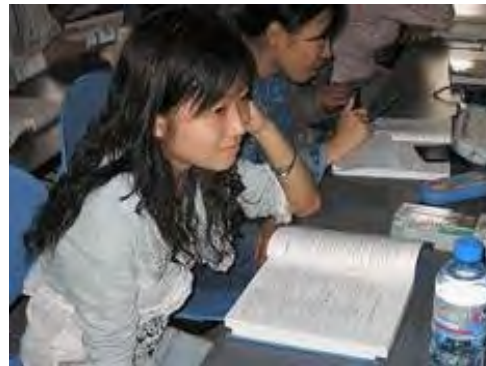
Unterricht in China

In erster Linie für Schülerinnen und Schüler der weiterführenden Schulen etwa ab Klasse 8.