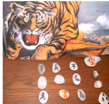
Kleines Märchen mit chinesischen Schriftzeichen geschrieben (Kinderakademie - Wangemann)

Für hochbegabte Grundschülerinnen und Grundschüler. „Einführung in chinesische Sprache und Schrift, in chinesische Sitten und Gebräuche in kindgerechter Form“