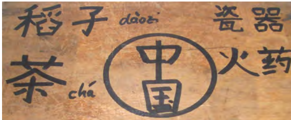
Das „Reich der Mitte“ (Wangemann)

Einführung in die chinesische Sprache (Mandarin) und Schrift (Pinyin und Schriftzeichen).