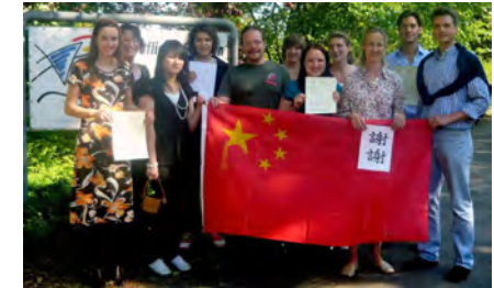
Zertifikate 2009 in Kehl

Durch eine mindestens 2-jährige Teilnahme mit regelmäßigem Unterrichtsbesuch und angemessenen Leistungen wird ein Zertifikat erworben, welches den/die Teilnehmer/in als „Chinaspezialist“ ausweist