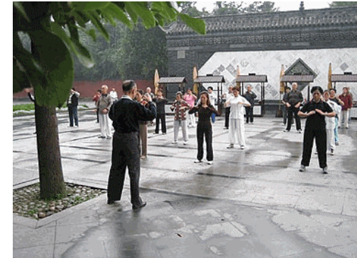
Schattenboxen am frühen Morgen

Kontaktadresse und weitere Informationen über die Projektschulen: www.china-ortenau.de -> „Kontakt / Anmeldung“